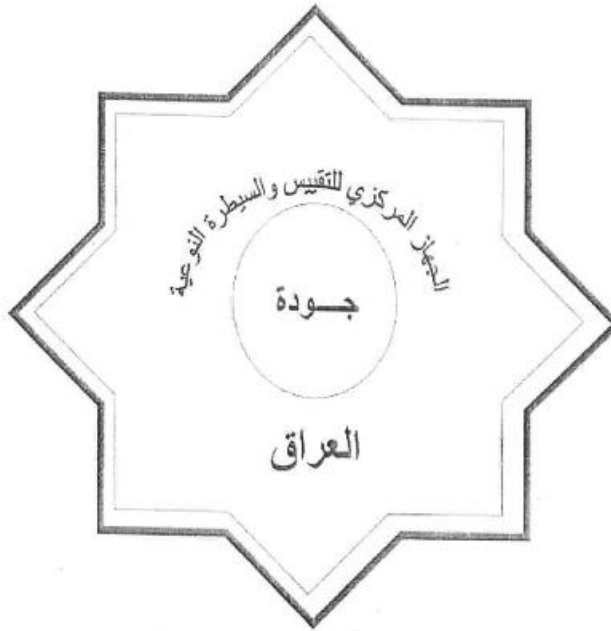
شكل رقم (١) نموذج علامة جودة المنتج