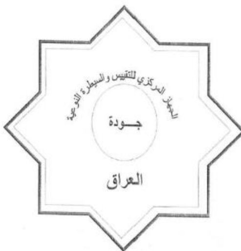
Figure 1 Sample product quality mark